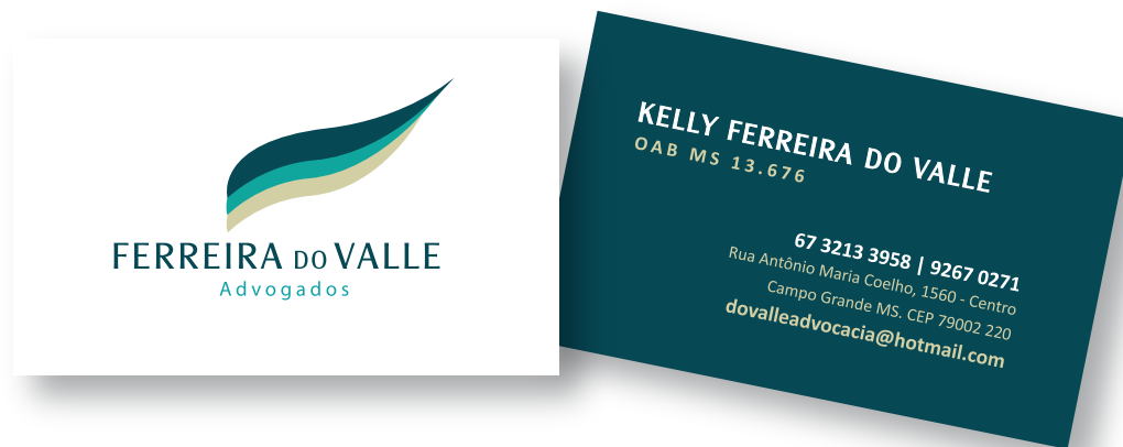
Cartão de visitas